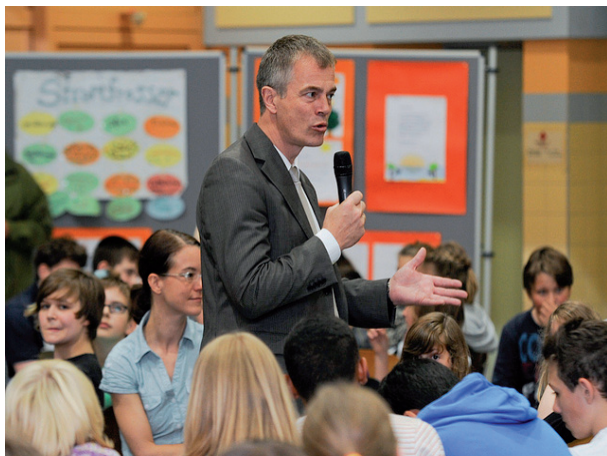
Minister Remmel stellt sich den Fragen der Schüler