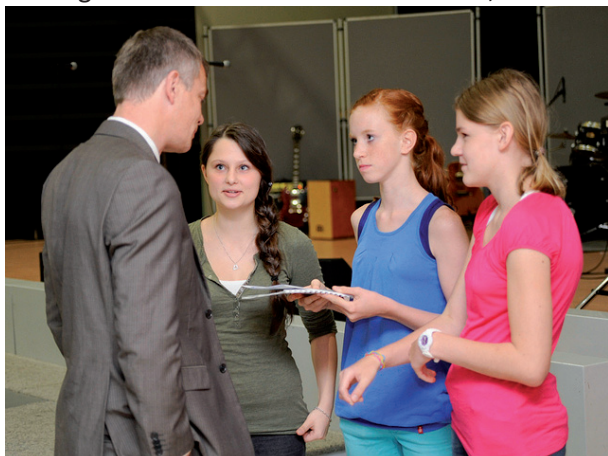
Einige wellis bitten den Minister um Unterstützung für unser Projekt.

Minister Remmel hat sich inzwischen bei uns gemeldet und uns gesagt, dass er unser Projekt toll findet. Da er selbst aber keine Möglichkeiten hat das Projekt zu unterstützen, hat er unsere Unterlagen mit der Bitte um Förderung an die Bezirksregierung weitergeleitet.