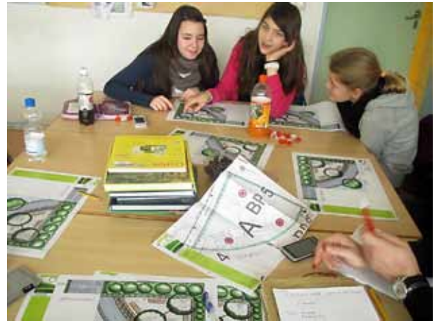
Jedes Detail wurde noch einmal kritisch gewendet und besprochen.

wurde vielseitig diskutiert. Der Plan fand Zustimmung. Darauf hin wurden die nächsten Schritte geplant. Die Schulleitung sollte informiert werden. Die Teammitglieder verteilten die Aufgaben, wer sich für welche Präsentationsbereiche vorbereitet und wer die Verabredung mit der Schulleitung trifft.