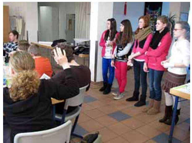
In der Fragenrunde war das grüne welle Team schon etwas entspannter.